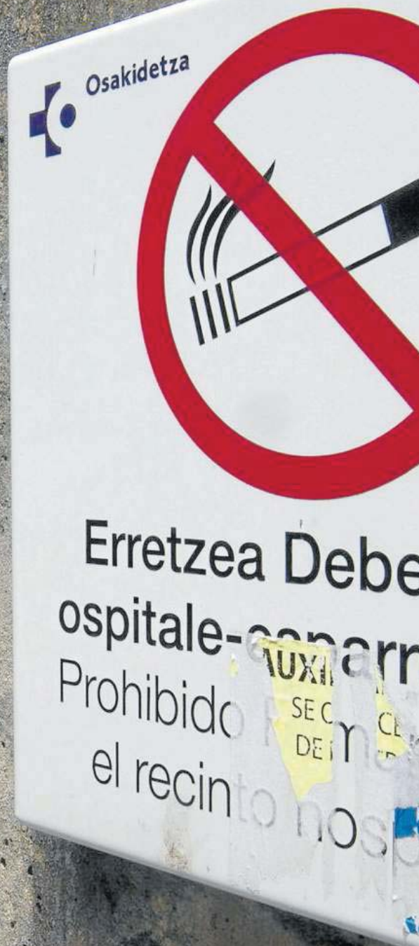
Los recintos sanitarios, como el HUA-Santiago, son desde hace varios años espacios vetados al tabaco.

Jiménez mira a la vecina Navarra, que desde hace algo más de dos años subvenciona no sólo Champix sino también otras terapias sustitutivas de tabaco como los parches de nicotina para justificar la inclusión del fármaco en el listado de medicamentos subvencionados por Osakidetza. "Se viene haciendo allí con buenos resultados. Al año de comenzar el tratamiento, cerca del 40% de los pacientes ya